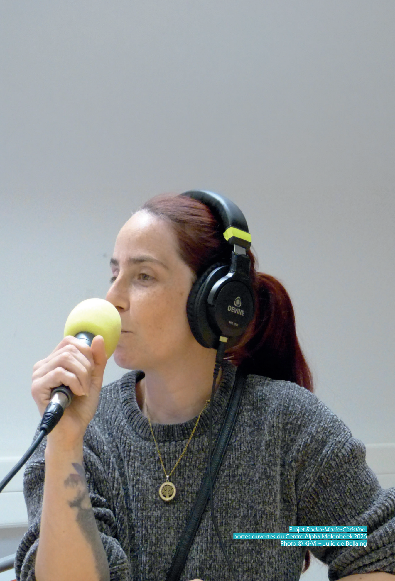
Projet Radio-Marie-Christine, portes ouvertes du Centre Alpha Molenbeek 2026